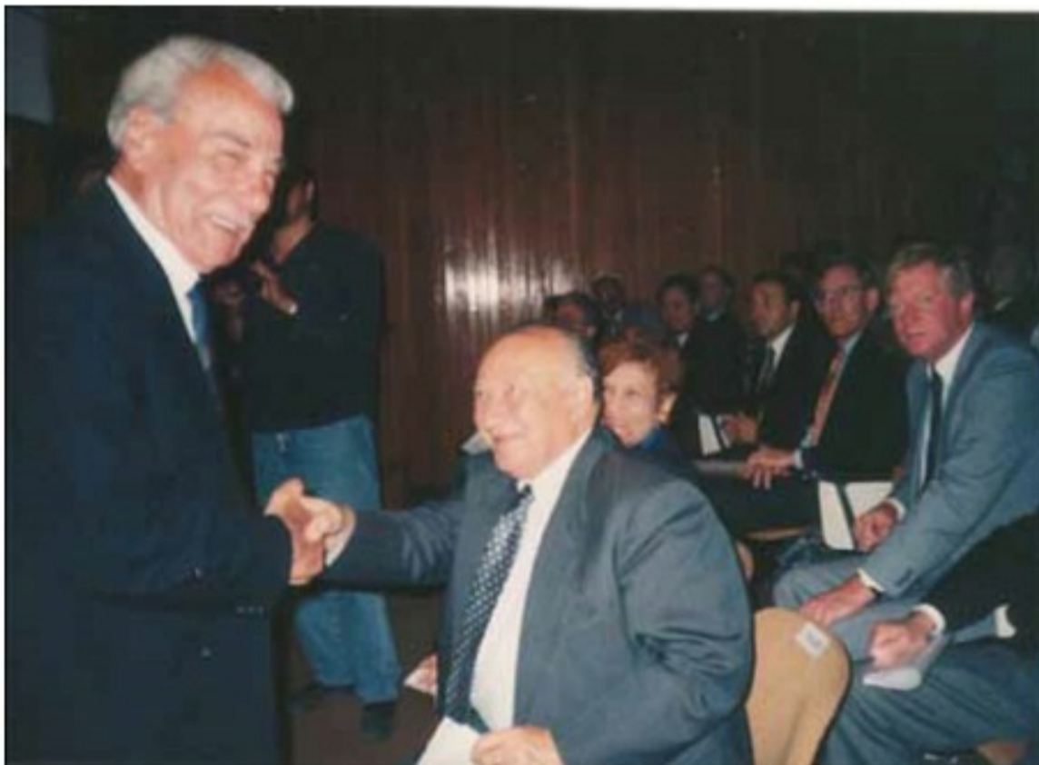
Ένα ακόμη στιγμιότυπο από την εκδήλωση της Ρωσικής Πρεσβείας στη Λευκωσία το 1995. Συγχαρητήρια από τον κ. Κληρίδη, Πρόεδρο της Δημοκρατίας.

τ/αγ. 4. Αγαμέμνων Γουλιέλμος. Base Depot RASC. 17.E.F. ' 6η 12/6/41. Ηγαυδιλή μου Καλλιόπη, πόσα λες δει είμαι ένθετος ναγα εδω λίγους ύστερα από τους δε ριδικούς έγδαα εις τον απο ορισμόν μου. Την 2/6/41 εως αχα ελίζη επιστολήν δις ξέρω όμως αν την εδήςεις. Δεν αγορά τους ποτήριου η περιπέτεια σου έγω σπασει ενολοαίς δις ηρωαρώ τα εαυ ελμυρια, εντοι όλαν ανταφωδει μεν. Αωθί την 28/6/41 γιάρη της 12/6/41 είχοντα εως ενα σουγγι σου ωστα εδω ηγ έμει ηγ γράνει να βρη την ζυγιά του ηγ εει την βρυσου. ηγ εις το λίγος ωαυ βρυσου την ζυγιά του, γαρτά σου ετιν καφάρ του.