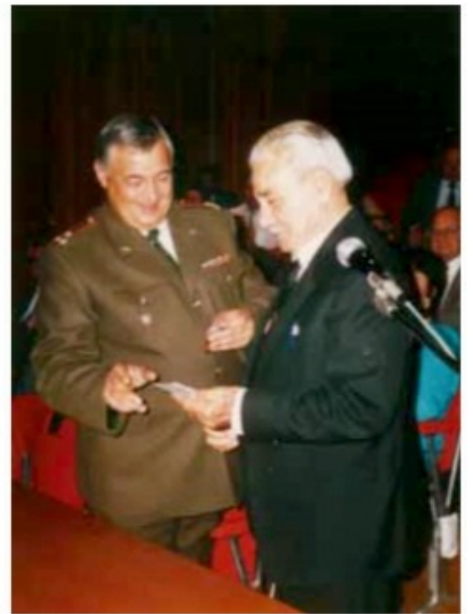
Στην εκδήλωση της Ρωσικής Πρεσβείας στη Λευκωσία, 1995.

σκοπισμένους δρόμους των χωριών. Καθώς οι Γερμανοί προχωρούσαν προς την Καλαμάτα, η μικρή ομάδα του Αγαμέμνονα είχε κυκλωθεί και δύσκολα θα απέφευγαν την αιχμαλωσία. Οι αξιωματικοί τους τούς είπαν, με τον ασύρματο, ότι δεν θα προλάβαιναν να φτάσουν στην Καλαμάτα. Τούς διέταξαν να βγάλουν τα στρατιωτικά τους, να φορέσουν πολιτικά για να μπορούν να κρύβονται και ο καθένας να προσπαθούσε να σωθεί μόνος του, ή σε μικρές ομάδες. Πάντα, αν τα κατάφερναν ν' αποφύγουν την αιχμαλωσία, ο προορισμός τους ήταν η Αίγυπτος