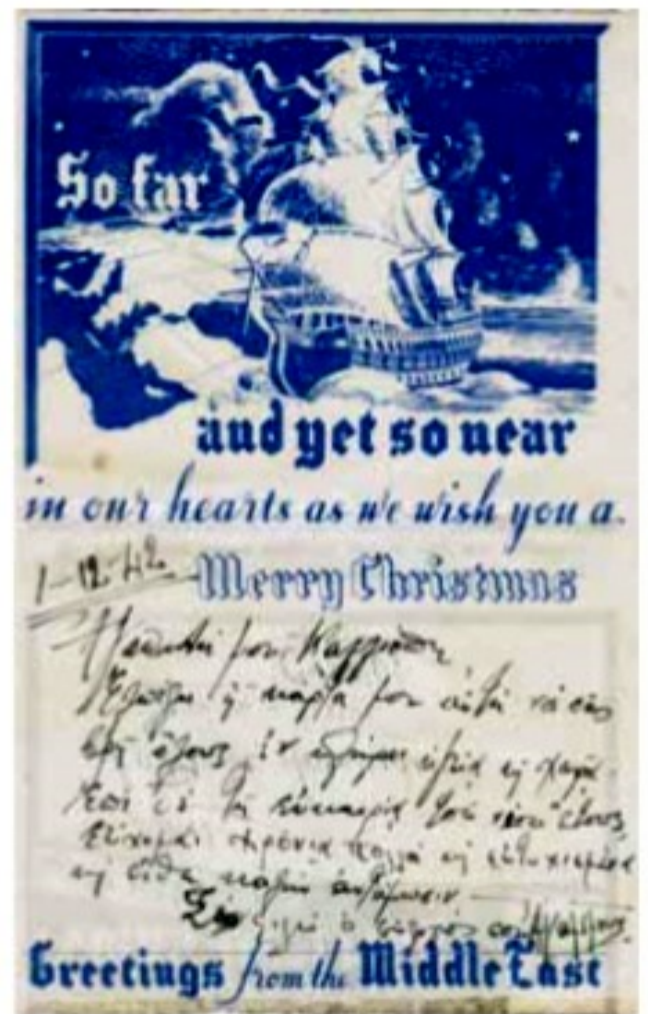
Χριστουγεννιάτικη κάρτα, 1942.