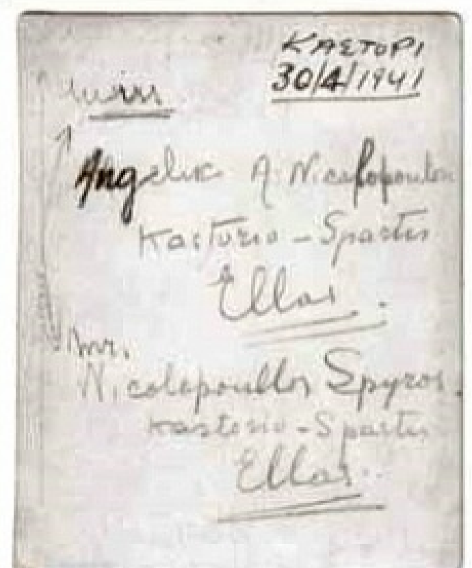
Πληγωμένος στο Μονοδέντρι Λακωνίας. Δεξιά: το πίσω μέρος της φωτογραφίας.