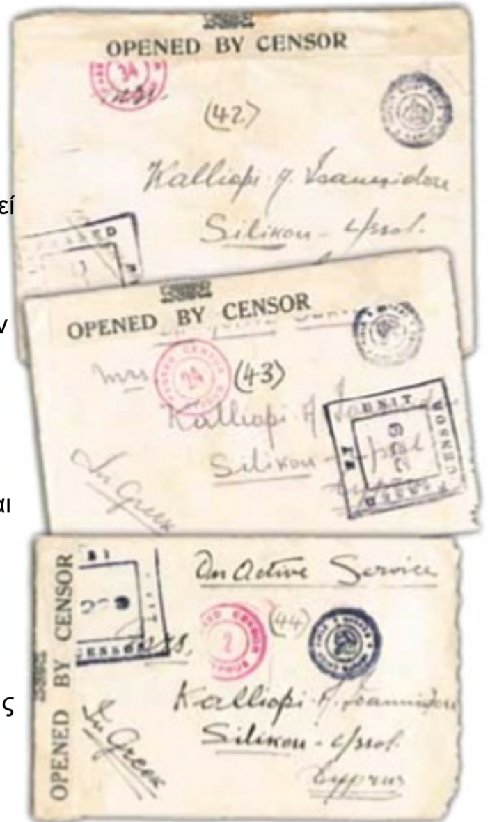
Γράμματα από το Μέτωπο.